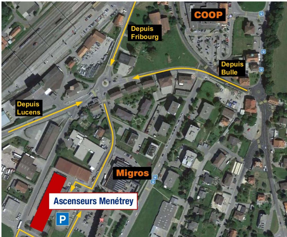
Rte de la Condémine 10 à Romont